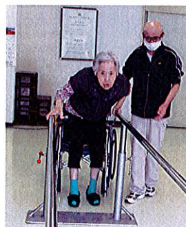
リハビリ機器 セラバイタル